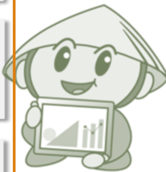
草津市公認マスコット「たび丸」